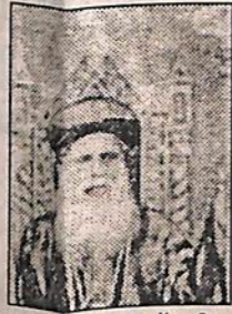
പ. ബസ്സേലിയോസ് ഗീവർഗ്ഗീസ് പ്രഥമൻ ബാവ